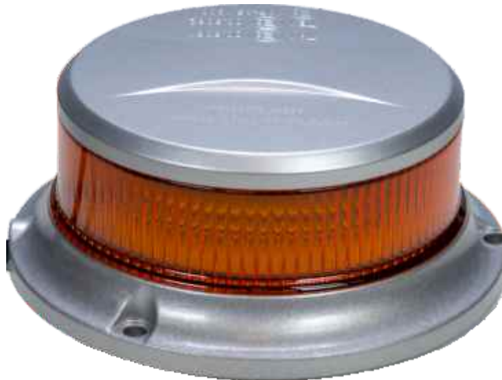
40 599 001 3-Punktbefestigung