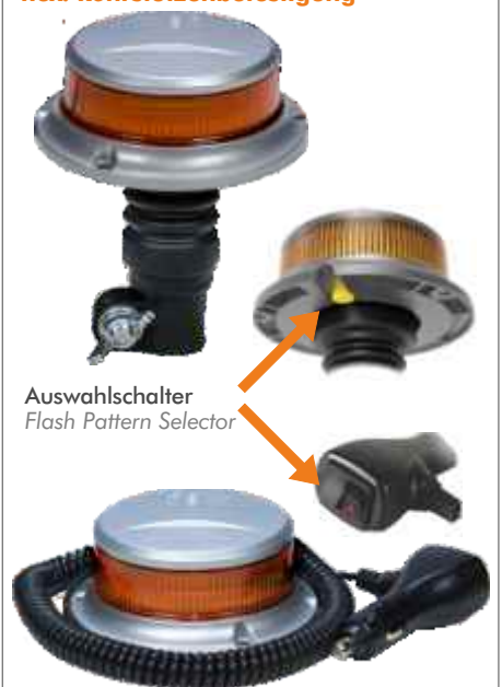
Auswahlschalter Flash Pattern Selector